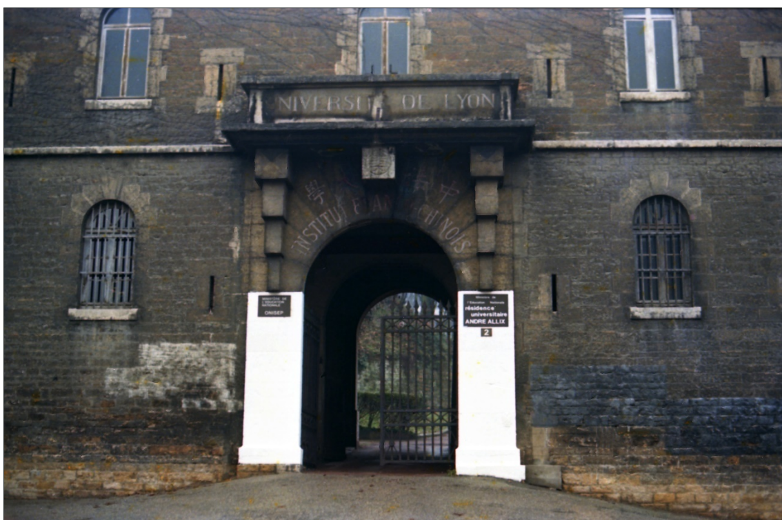
位于圣伊雷内堡的里昂中法大学大门 朱新天女士拍摄，1987 年