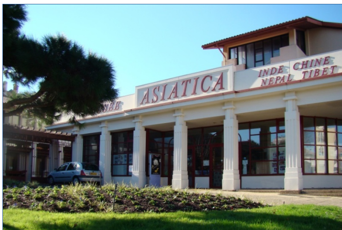
法国东方艺术博物馆 ASIATICA 的正门

这部电视片记录了里昂中法大学的历史，也谈到了中法大学毕业的精英们。但影片中所能谈到的，也仅仅是为数不多的十来个人。我们无法苛求纪录片的导演，但仅仅这十几个人是无法代表这些为中国的科学文化艺术奠基的群体，也无法将他们在新中国的建立和建设中所作出