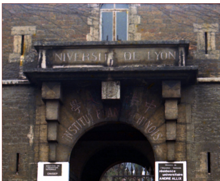
法国里昂中法大学的正门 1987年