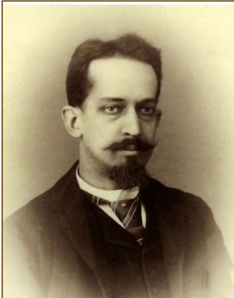
莫里斯·古恒 Maurice COURANT (1865-1935)

莫里斯·古恒是一位汉学家，也是东方语言教师。19世纪末，他曾在法国驻北京大使馆担任中文翻译，在法国驻首尔大使馆从事秘书工作，还担任过外交部长的翻译。他对中国、韩国和日本的文化、文学和历史社会等领域做了许多研究，并有相关著作存世。