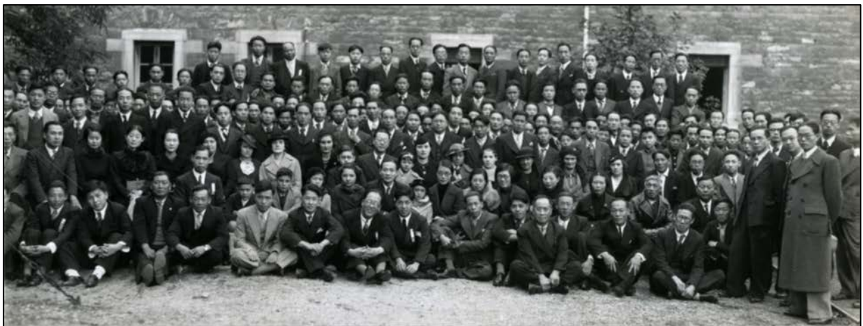
1937年10月10日，里昂华侨救国会成立纪念摄影 里昂中法大学的中国学生和旅法华人，在里昂中法大学的礼堂前合影